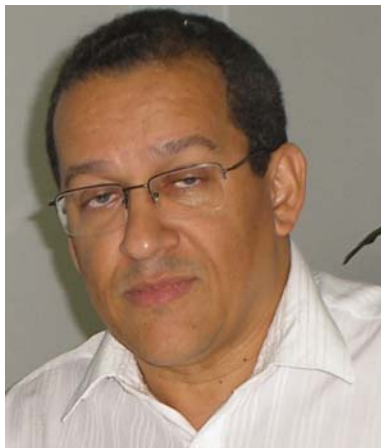
Cleudes: obrigação do gestor

Do ponto de vista contábil, tivemos, em 2006, um ano atípico em razão dos valores elevados no custeio de internamentos. Segundo o diretor administrativo-financeiro, Domenico Fioravanti, foram verificados dois picos de despesas, nos meses de julho e setembro, que impactaram no resultado negativo do ano, com reflexo no valor da conta de novembro, e no