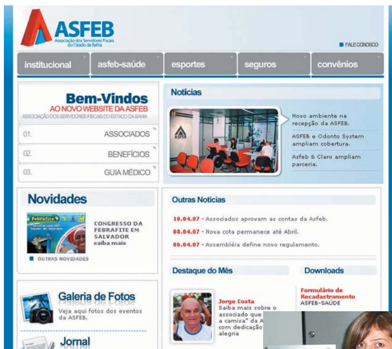
Wadja: um desenho mais moderno e funcional

Na seção de Esportes, serão veiculadas as informações das atividades desenvolvidas, regulamentos e tabelas de campeonatos, resultados dos jogos e fotos. Os benefícios disponibilizados para os associados contarão com duas seções distintas: Seguros e Convênios. "O objetivo é destacar os seguros, que ofertamos com melhores preços e prazos maiores do que o mercado e dar maior visibilidade às empresas que concedem descontos para os associados", diz Wadja.