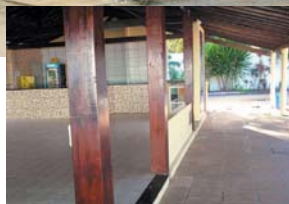
Reforma melhora ambiente

bar/restaurante do clube Costa Verde. Já para gerenciar a parte de limpeza e manutenção, foi contratada a empresa Exemplo, também com experiência na área de administração de condomínios.