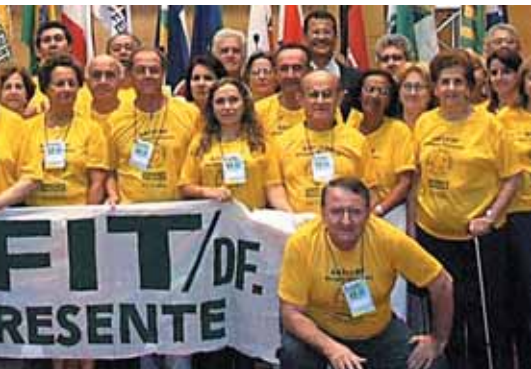
a do Distrito Federal (acima)