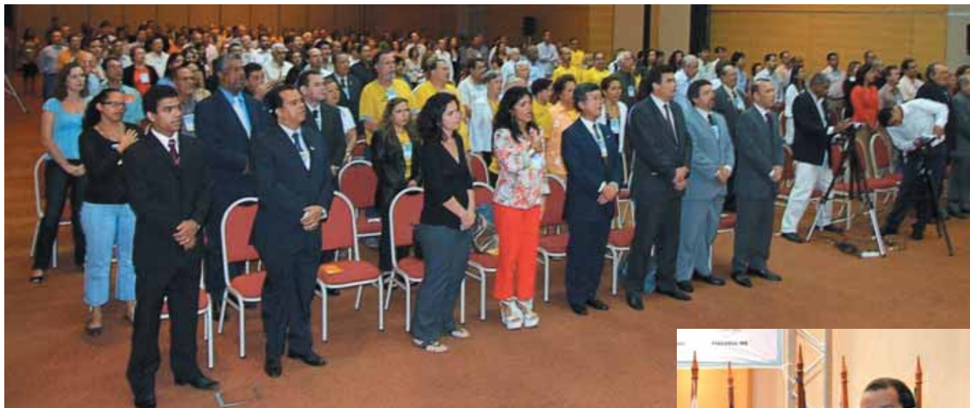
O encontro contou com a presença de representantes de todos os estados

Autonomia do fisco estadual, reforma tributária, previdência social e sustentabilidade dos regimes próprios e tributos verdes foram alguns dos temas debatidos durante o VI Congresso Nacional da Febrafite, que reuniu em Salvador, no período de 4 a 7 de junho, fiscais de tributos estaduais de todo o país. Participaram do encontro autoridades políticas como os senadores Paulo Paim (PT-RS), o ex-governador do Rio Grande do Sul e ex-deputado federal, Germano Rigotto (PMDB), e o deputado federal João Eduardo Dado (PDT-SP), representando o Congresso Nacional, Rogério Macanhão,