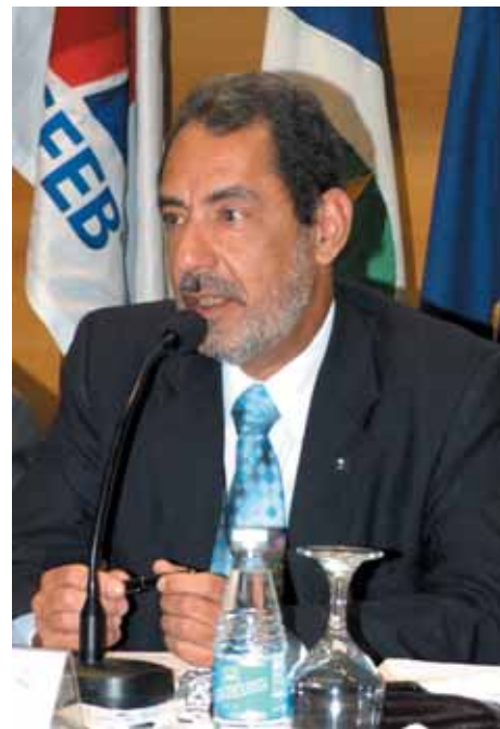
Aymoré defende regimes próprios

“Vamos imaginar 33% de contribuição previdenciária sobre o valor total da folha mensal de pagamento de cada ente multiplicado por 35 anos de contribuição – tempo mínimo exigido para aposentadoria dos homens.