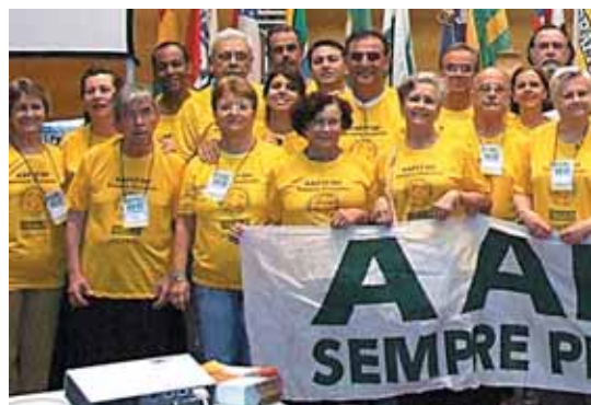
Depois da delegação Bahia, as maiores delegações do VI Congresso Nacional foram a do estado do Ceará (à esquerda) e